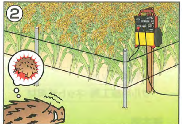
柵は危険と学習させる心理柵