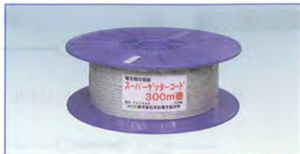
コード拡大写真 高伝導性ワイヤー使用

注文No.402 ゲッターコード 200m 直径：約2.2mm 化学繊維と金属線をよりあわせ従来品に比べさらに耐久性がよくなっています。ロープ状で、設置や撤去がとっても簡単です。