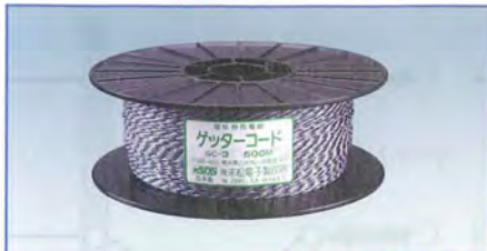
コード拡大写真 高伝導性ワイヤー使用

注文No.401 ゲッターコード 500m 直径：約2.2mm 化学繊維と金属線をよりあわせ従来品に比べさらに耐久性がよくなっています。ロープ状で、設置や撤去がとっても簡単です。